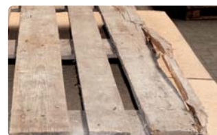
Quer-, an- oder durchgebrochenes Brett