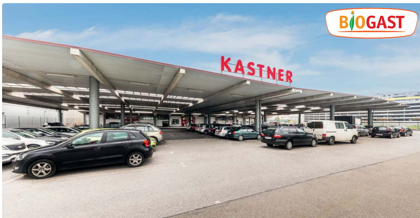
Bürostandort 1210 Wien, Baldassgasse 3

Hinweis: Bei der Verrechnung ist zu beachten, dass die Liefer- und Rechnungsadresse immer der Firmensitz BIOGAST Zwettl ist.