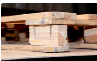
Sichtbare Befestigungselemente z.B.: Nägel