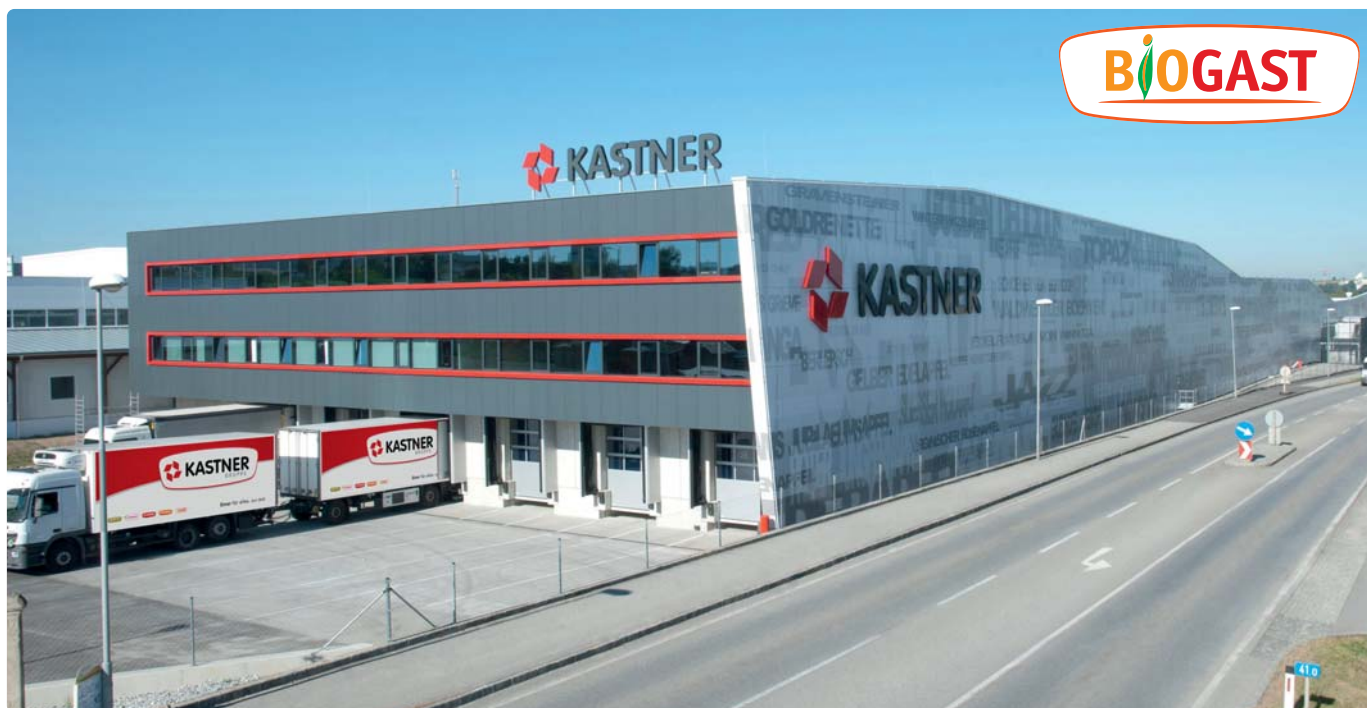
Firmensitz / Lagerstandort 3910 Zwettl, Karl Kastner-Straße 1