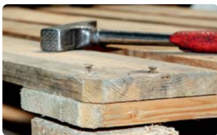
Einschlagen herausstehender Befestigungselemente.

T zulässige Mängelbeseitigung durch Verwender zur Qualitätsklassifizierung (A, B):