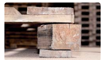
Verdrehter Klotz > ca. 1 cm