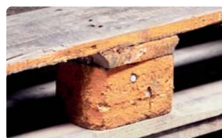
Verunreinigungen, die an Ladegüter abgegeben werden können, z.B.: Farbe, Öl, Geruch, Schimmel, Stockflecken etc.