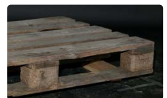
Keine vorgeschriebene Kennzeichnung mehr lesbar