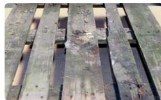
Trocknung/Reinigung durchnässter Bretter.

A Reparatur nur durch lizenzierten Reparaturbetrieb zulässig: