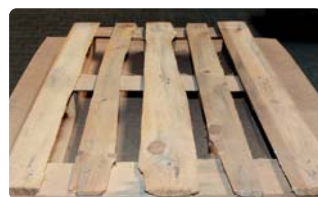
Unzulässiges Bauteil, z.B.: untermaßig, morsch, Baumkante